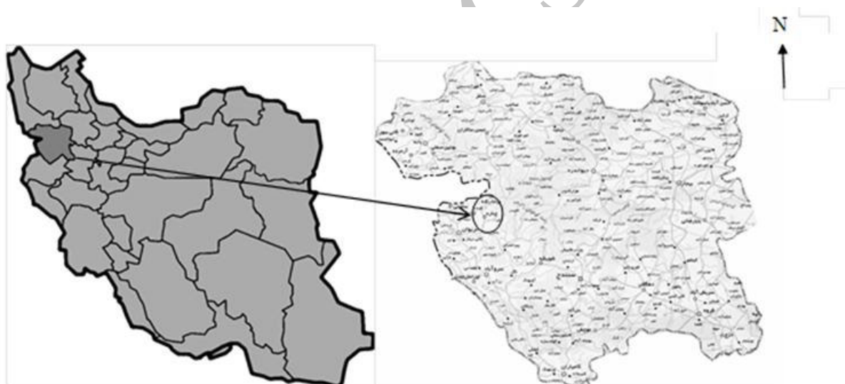
شکل ۲- موقعیت منطقه مورد مطالعه (مقیاس ۱:۲۵۰۰۰)

شهر چناره مرکز بخش سرشویو از شهرستان مریوان استان کردستان است که در ۲۵ کیلومتری شمال‌غربی این شهرستان واقع شده است. این شهر در مسیر اصلی