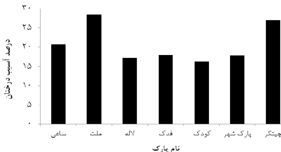
شکل ۲. درصد آسیب در پارک‌های بررسی شده