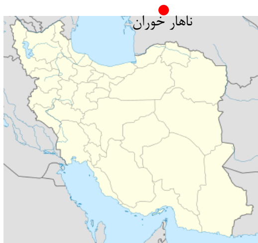
شکل ۱. موقعیت جغرافیایی ناهارخوران

شهر و ساخت و سازهای انبوه نه تنها پوشش گیاهی منطقه را در معرض تهدید و نابودی قرار داده است، بلکه شلوغی ایجاد شده انواع آلودگی‌ها از جمله آلودگی صوتی را باعث شده است. بر اساس مطالعات انجام شده (Mazidi et al., 2000)، این منطقه در رتبه‌بندی گردشگری با امتیاز ۲۲ در کلاس سوم به لحاظ پتانسیل