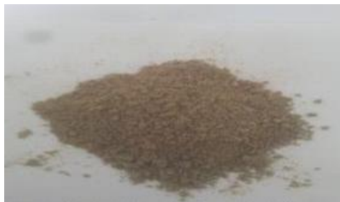
شکل ۴- نمونه کنده‌های تثبیت شده با خاک دیاتومه

نتایج تست شین نشان داد که با استفاده از مقدار بهینه خاک دیاتومه جهت پایدارسازی کنده‌ها، پس از مخلوط شدن نمونه‌ها با آب، هیچ گونه ذرات روغنی بر روی سطح آب مشاهده نمی‌شود و این امر نشان دهنده جذب کامل مواد روغنی از پسماند حفاری می‌باشد. همچنین اندازه گیری pH نمونه‌های تثبیت شده نشان داد که بر خلاف مواد شیمیایی مورد استفاده در پایدارسازی کنده‌ها، خاک دیاتومه تغییری در pH پسماندهای تثبیت شده ایجاد نمی‌کند.