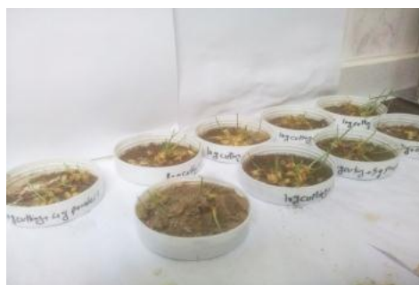
شکل ۵- کشت گندم در نمونه‌های تثبیت شده با خاک دیاتومه

جهت بررسی امکان ترمیم خاک، کنده‌های پردازش و تثبیت شده با خاک دیاتومه به عنوان محیط کشت برای بذر گندم استفاده شد. همان طور که در شکل ۵