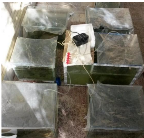
شکل ۱- نمای کلی از آکواریوم‌ها

C= غلظت نیترات در نمونه نهایی بعد از دوره زمانی مورد مطالعه برای تعیین وزن تر گیاهان، نمونه‌های گیاهی با الک برداشت شدند و دو دقیقه بین دو کاغذ خشک‌کن قرار