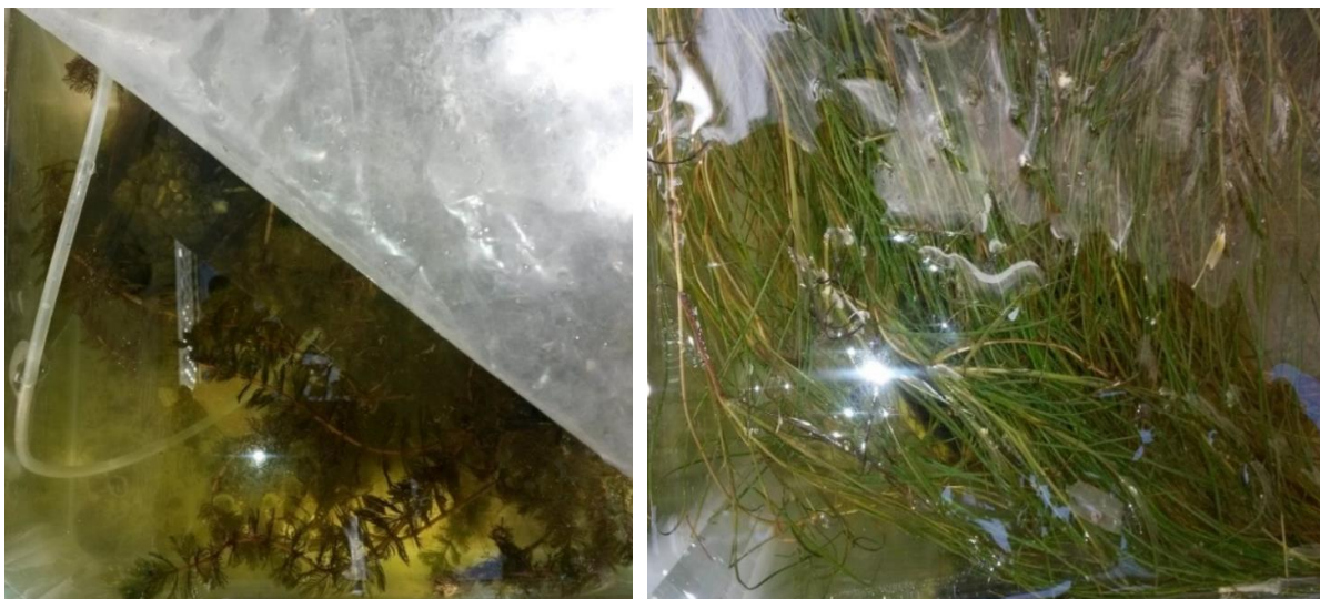
شکل ۲- چپ: آکواریوم حاوی Myriophyllum spicatum راست: آکواریوم حاوی گیاه Ruppia maritima