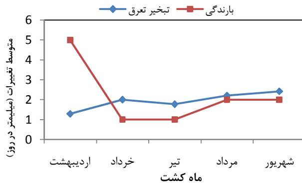
شکل ۱- اطلاعات ایستگاه سینوپتیک هواشناسی کشاورزی رشت در سال زراعی ۱۳۸۶