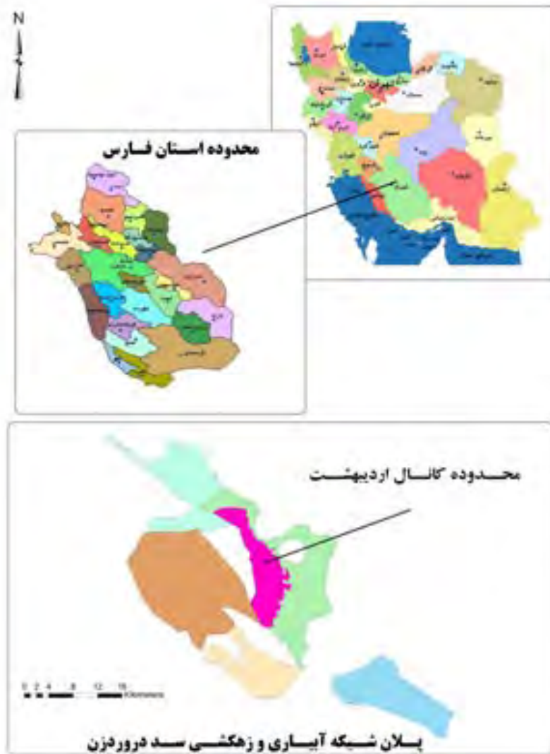
شکل ۱- موقعیت کانال اردبیهشت در محدوده شبکه آبیاری و زهکشی سد درودزن

سطح ایستابی، زهکشی آزاد، جریان عمودی صفر، رابطه جریان عمودی و سطح ایستابی است. توصیف و تشریح