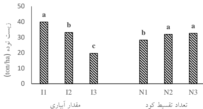
شکل ۲- اثر سطوح آبیاری و تعداد تقسیط کود نیتروژن بر زیست توده