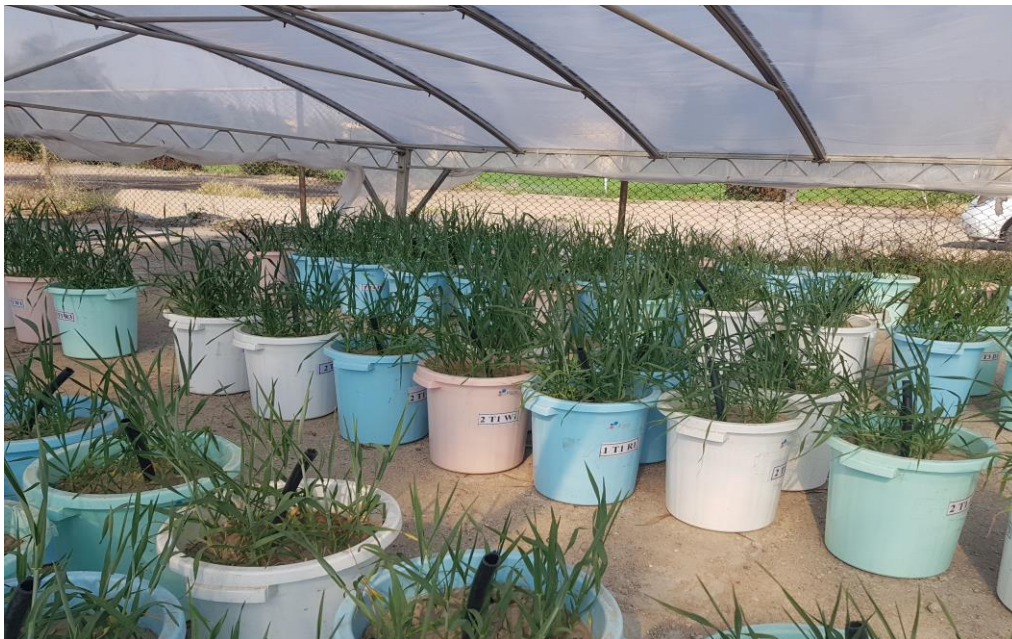
شکل ۱- نمایشی از محل اجرای پژوهش و استقرار سایه‌انداز متحرک بر روی گلدان‌ها

رشد گیاه) برابر با ۱۹/۱ لیتر به دست آمد. مقدار آب مصرفی در تیمارهای مختلف تنش کم آبی در محدوده ۹/۶ تا ۱۶/۴ لیتر متغیر بود و به شدت تنش در مراحل مختلف رشد گیاه وابسته بود. اعمال تیمارهای مختلف تنش کم-آبی موجب کاهش معنی‌دار میانگین مصرف آب گردید (شکل ۳). میانگین مقدار کل آب مصرفی در تیمارهای مختلف با اعمال شدت‌های مختلف تنش کم آبی در تمام مراحل رشد گیاه از ۳۱ تا ۴۳ درصد کمتر از تیمار آبیاری کامل بود. در حالی‌که اعمال تنش کم آبی فقط در یک مرحله از رشد گیاه گندم موجب کاهش ۱۷ تا ۳۶ درصد در میانگین مصرف آب آبیاری شد. بیشترین و کمترین میانگین آب مصرفی به ترتیب در تیمار آبیاری کامل (۱۹/۱ لیتر) و سناریو اعمال بیشترین شدت تنش کم آبی (تیمار مکش ۱۰۰۰۰ سانتی‌متر) در تمام دوران رشد گیاه (۱۰/۹