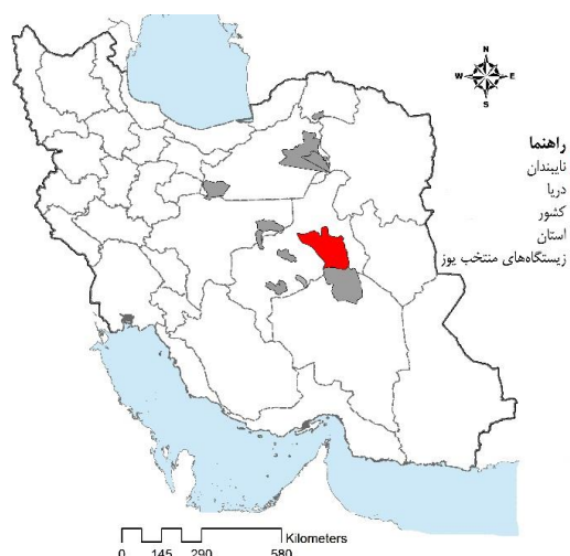
شکل ۱- نقشه موقعیت پناهگاه حیات وحش نایبندان در ایران و نسبت به سایر زیستگاه‌های یوز