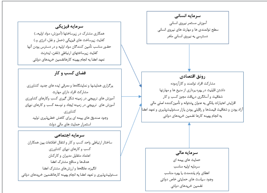
نگاره ۱- مدل نظری تأثیر سرمایه های انسانی و اجتماعی در رونق کسب و کارهای کوچک و متوسط کشاورزی