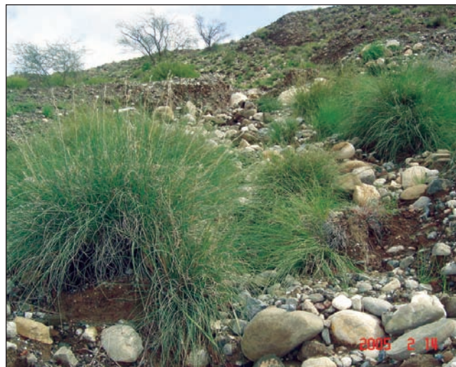
تصویر ۱- گیاه Cymbopogon olivieri

رسوبات مختلف کالرد ملائز (رسوبات رنگی) مخلوط رسوبی و آذرین و دگرگونی، واریزه‌های آهک‌های آسماری جهرم و آهک‌های آمیوسن، گروه فارس آهک و سازند میشان، کنگلومرای بختیاری، آهک همراه