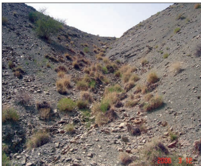
تصویر ۲- رویشگاه گونه Cymbopogon olivieri در آبراهه‌ها و دره‌های بشاگرد

رویشگاه این گونه در منطقه شیخ حضور (بستک) بسیار سنگلاخی و جهت شیب تیپ شمالی و میزان آن ۱۰ تا ۱۵ درصد می‌باشد. میزان کل پوشش گیاهی ۱۱/۳۷ درصد که از این میزان ۴/۲۷ درصد مربوط به گونه گیاهی ناگرد می‌باشد. در منطقه سرزده خارو جهت شیب منطقه شرقی - غربی و میزان شیب در این تیپ در کلاس‌های ۱۰ تا ۱۵، ۱۵ تا ۳۰ و قسمتی در کلاس ۳۰ تا ۶۰ درصد می‌باشد. میزان کل پوشش گیاهی در این تیپ ۱۵/۶۱ درصد می‌باشد که از این میزان ۹/۵۶ درصد مربوط به گونه گیاهی ناگرد می‌باشد. در منطقه بشاگرد جهت شیب منطقه عموماً شرقی - غربی است و میزان شیب در این منطقه، در کلاس‌های ۱۰ تا ۶۰ درصد می‌باشد. میزان کل پوشش گیاهی در این تیپ ۱۱/۹ درصد می‌باشد که از این میزان ۴/۷ درصد مربوط به گونه گیاهی ناگرد می‌باشد. شایان ذکر است که در قسمت‌هایی که به دلیل فرسایش زیاد و تخریب سطح