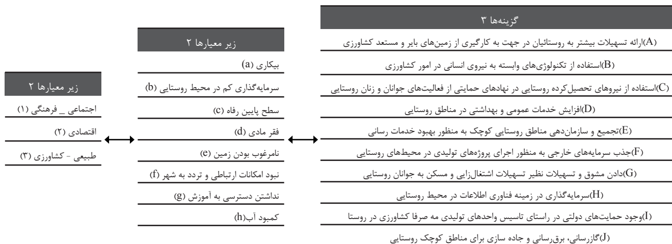
جدول ۲- مدل طرح شده در نرم افزار Super Decision

مورد ماتریس مقایسه‌ای معیارهای اصلی (جدول ۳) ضریب ناسازگاری برابر با ۰/۰۰۳۶ گردید و چون این عدد کمتر از ۰/۱ می‌باشد، قابل قبول است.