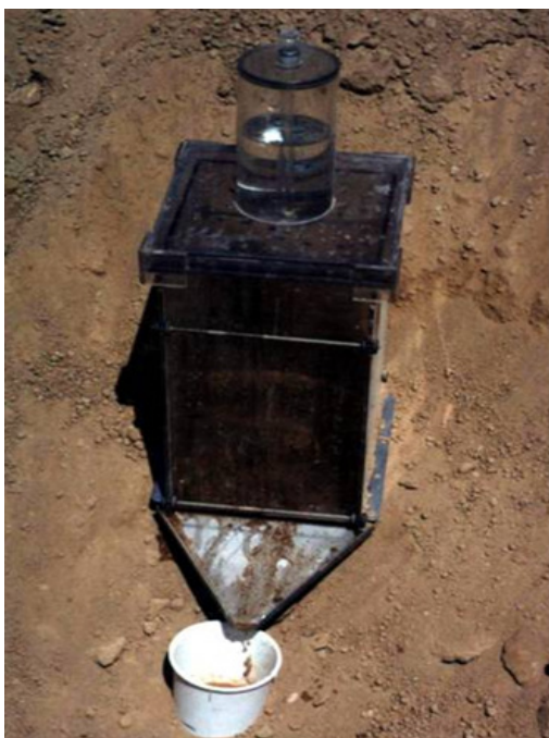
شکل ۳- نمایی از جمع‌آوری رواناب و رسوب توسط شبیه‌ساز باران