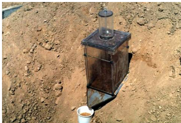
شکل ۲- نمایی از شبیه‌ساز باران کوچک مورد استفاده در این تحقیق