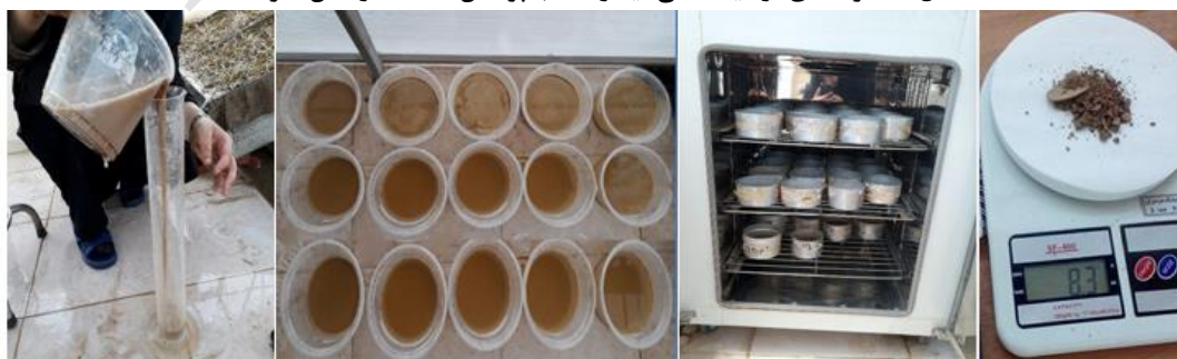
شکل ۳- مراحل برآورد روان آب و رسوب (مواد معلق).