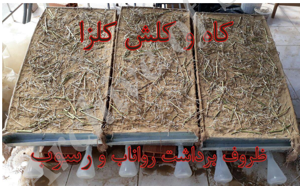
شکل ۲- کرت‌های آزمایشگاهی تیمار شده با پوشش ۲۵٪ کاه و کلش کلزا.

پس از تهیه‌ی خاک و کاه و کلش برای ایجاد شرایط معیار مشابه با طبیعت، و زهکشی بهتر (دفراشا و همکاران ۲۰۱۱) ۱۰ سانتی‌متر اول عمق کرت‌ها با پوک‌هی معدنی با لایه‌بندی متفاوت پر شد، و ۱۰ سانتی‌متر باقی‌مانده با خاکی با ترازهای رطوبت ۱۵، ۲۰ و یا ۳۰٪ پر شد. سطح خاک با غلطک به وزن مخصوص خاک (۱/۴۶ گرم بر سانتی‌متر مکعب خاک در شرایط طبیعی) رسانده شد (کاویان و همکاران ۲۰۱۵). برای مخلوط نشدن خاک با پوک‌هی معدنی و جابه‌جایی سریع خاک، در مراحل آزمایش یک لایه‌ی گونی کفنی بین پوک‌هی معدنی و خاک گذاشته شد. پس از واسنجی شبیه‌ساز باران، کرت‌های بی‌پوشش حفاظتی (شاهد) با خاک ۱۵٪ رطوبت، در بارش شبیه‌سازی شده‌ی ۵۰ میلی‌متر بر ساعت با تداوم بارشی ۱۰ دقیقه‌ی گذاشته، و روان آب و مواد معلق تولیدشده برداشت شد. مراحل آزمایش قبلی جداگانه برای خاک با رطوبت‌های ۲۰ و ۳۰٪ تکرار و نمونه‌های روان آب و مواد معلق تولیدشده‌ی این دو تراز رطوبتی خاک بی‌پوشش حفاظتی (شاهد) برداشت شد. در مرحله‌ی بعدی، آزمایش بر سطح خاک کرت‌های ۱۵٪ رطوبت و پوشانده‌شده‌ی یکنواخت با ۲۵٪ کاه و کلش کلزا (انصاری ۲۰۰۷) انجام، و روان آب و مواد معلق تولیدشده برداشت شد (شکل ۲). بعد از انجام آزمایش،