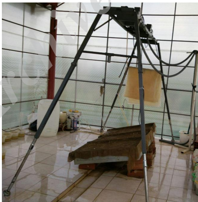
شکل ۱- شبیه‌ساز باران به‌کاررفته در این پژوهش.

شبیه‌ساز باران تشکیل‌شده از قسمت‌های مختلف سامانه‌ی آب‌رسانی، صفحه‌ی بارش، سامانه‌ی جمع‌آوری آب مازاد، و برد مهارکردنی است. صفحه‌ی بارش شامل دو افشانه‌ی نوسانی از نوع ویجت ۸۰۱۰۰ با قطر روزنه‌ی ۴/۵ میلی‌متر با قابلیت جابه‌جایی روی راه‌آه‌نی به طول دومتر است