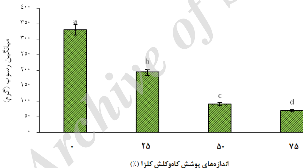
شکل ۵- نمودار مقایسه‌ی میانگین مواد معلق در تمام ترازهای رطوبت در اندازه‌های مختلف پوشش حفاظتی.

جلوگیری نموده (مایاتا و همکاران ۲۰۰۹) و مانند پوششی محافظتی سبب می‌شود که خاک کمتر در معرض خطر فرسایش قرار گیرد، و اندازه‌ی مواد معلق و هدررفتن خاک را کم می‌کند (جویدن و همکاران ۲۰۱۰؛ مورینو و همکاران ۲۰۰۹). طبق جدول ۱، با اعمال پوشش حفاظتی اندازه‌ی روان آب و مواد معلق تولیدشده نسبت به تیمار شاهد بسیار کاهش یافته است. با افزایش بیش‌تر اندازه‌های پوشش حفاظتی این روان آب و مواد معلق تولیدشده کاهش بیش‌تری می‌یابد، به طوری که بیش‌ترین و کم‌ترین روان آب و مواد معلق تولیدشده در بی‌پوشش حفاظتی (شاهد) و پوشش ۷۵٪ حفاظتی کاه و کلش