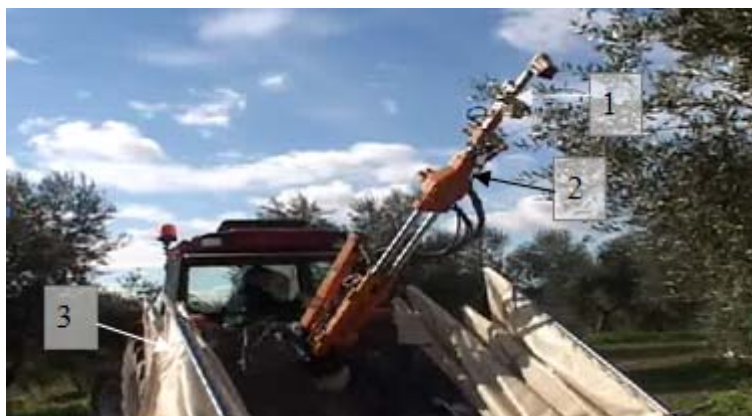
شکل ۱- دستگاه تک‌کاننده Arcusin و قسمت‌های اصلی آن: (۱) گیره (۲) ارتعاش دهنده یا لرزاننده (۳) چتر Fig. 1. Arcusin shaker machine and its main components: 1) Clamp 2) Vibrator 3) Umbrella

مقادیر میزان برداشت و درصد میوه‌های آسیب دیده در سطوح مختلف بسامد است. با افزایش بسامد ارتعاش از ۵ تا ۱۰ هرتز، میزان برداشت به‌طور معنی‌داری حدود ۲۰ درصد افزایش می‌یابد. دلیل این امر را می‌توان این‌گونه توجیه نمود که با افزایش بسامد ارتعاش، نیروهای دینامیکی و تنش‌های نوسانی وارد بر نقطه اتصال دم میوه به‌شاخه افزایش یافته و تنش خمشی به‌همراه تنش‌های کششی در سطح ساقه و دم میوه، موجب قطع ساقه یا جدا شدن دم میوه می‌گردد که باعث ریزش بیشتر میوه می‌شود (Srivastava et al., 1993). بیشترین میزان برداشت پرتقال تامسون ۶۲/۸ درصد در بسامد ۱۰ هرتز است. تاروگروسا و همکاران نیز نتایج مشابهی بر میزان برداشت پرتقال والنسیا با ۶۷ درصد در بسامد ارتعاشی ۱۵ هرتز دست یافته بودند (Torregrosa et al., 2009). اگرچه بسامد ارتعاشی بکار گرفته شده در تحقیقات آن‌ها بیشتر بود ولی افزایش چندانی در میزان برداشت دیده نمی‌شود. همچنین در تحقیق جداگانه که بر روی لیمو ترش صورت گرفت بسامد ارتعاشی ۱۰ هرتز به‌عنوان مناسب‌ترین حالت برای جداسازی میوه لیمو ترش شناخته شد. زیرا بسامدهای بالاتر منجر به ریزش برگ‌ها می‌گردد (Loghavi and Mohseni, 2005).