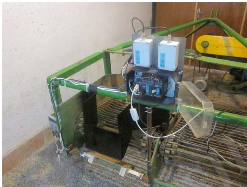
شکل ۲- ماشین برداشت سیب‌زمینی زنجیر نقاله‌ای به همراه تجهیزات مورد استفاده