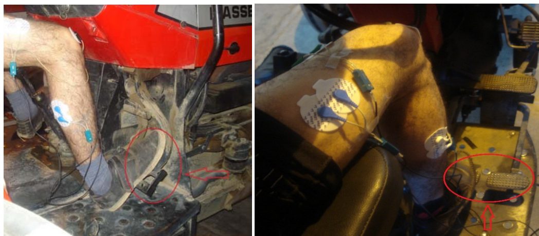
شکل ۲- اندازه‌گیری تنش وارد بر عضلات کاربر در استفاده از مکانیزم ترمز (سمت راست: تراکتور MF285 و سمت چپ: تراکتور MF399) Fig.2. Measurement of muscle stress of drivers while using the brake pedal (Left: MF399 tractor and right: MF285)

در مرحله بعد کاربر روی صندلی تراکتور نشست و از او خواسته شد در وضعیت طبیعی روی صندلی بنشیند. در این حالت فعالیت الکتریکی عضلات به مدت ۳۰ ثانیه ثبت شد. همان‌طوری که دستگاه در حال ثبت فعالیت الکتریکی عضلات بود، از کاربر خواسته شد که پدال (ترمز یا گاز) را تا انتها فشار دهد و این وضعیت را ۶۰ ثانیه حفظ نماید. پس از ۶۰ ثانیه فشردن پدال، از کاربر خواسته شد که پای خود را از روی پدال برداشته و به مدت ۶۰ ثانیه به حالت طبیعی روی صندلی تراکتور بنشیند تا در این وضعیت نیز فعالیت الکتریکی عضلات شش‌گانه ثبت گردد. شکل‌های ۲ و ۳ به ترتیب نحوه انجام آزمایش‌ها را در حین گرفتن پدال‌های ترمز و گاز نشان می‌دهد. با توجه به مدت زمان طولانی ثبت فعالیت الکتریکی عضلات، برای هر عضله در هر آزمایش در حدود ۱۸۰ هزار داده موجود بود. با توجه به این که داده‌ها مقادیری مثبت و منفی بودند، از آن‌ها مطابق