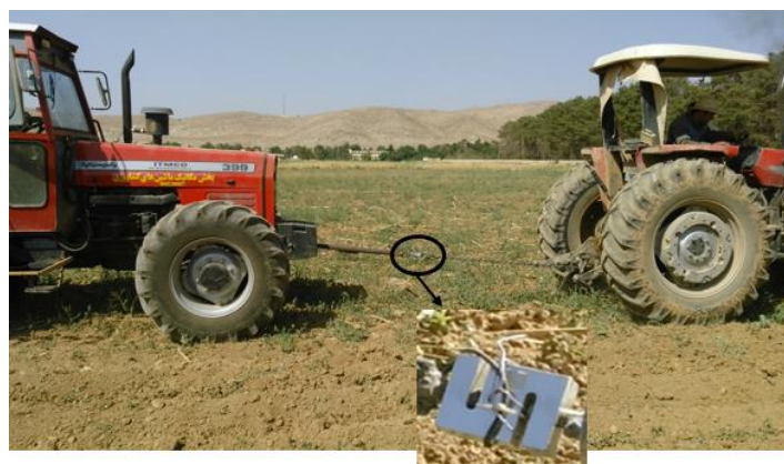
شکل ۲- آزمون دو تراکتوری و نیروسنج متصل شده بین دو تراکتور Fig.2. RNAM test code and Load cell connected between two tractors

(SDA)، سطح مقطع بالآمدگی خاک (SUA) و مقاومت ویژه (SR) بودند که به‌عنوان عوامل مستقل در معادله‌ها مدنظر بودند. مزرعه آزمایشی براساس آزمایش کرت‌های دو بار خرد شده بر پایه‌ی طرح کامل تصادفی و در سه تکرار، کرت‌بندی گردید. داده‌برداری در این پژوهش به کمک یک سامانه جمع‌آوری داده که توسط Rahmanian-Koushaki et al. (2015) ساخته شده،