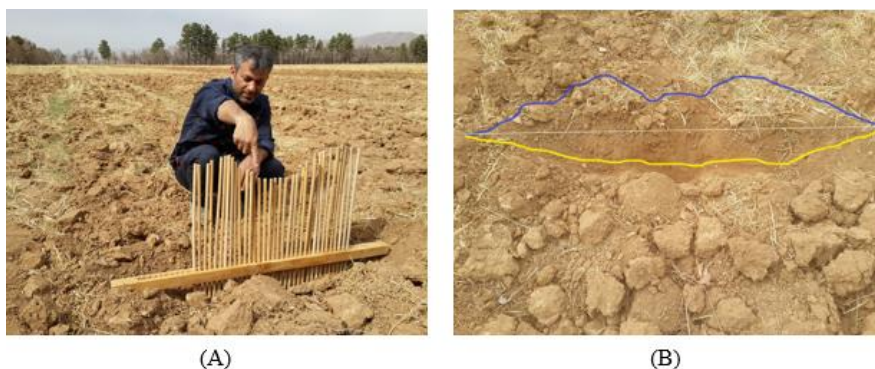
شکل ۳- A- نحوه استفاده از پروفیل‌متر، B- سطح مقطع به هم خوردگی و بالا آمدگی خاک Fig.3. A- How to use profilometer, B- Disturbance and upheaving area of the soil

شده در این پژوهش برای تیمارهای مد نظر معنی‌دار شده است. به همین دلیل از تمام عوامل اندازه‌گیری شده می‌توان در معادله‌های رگرسیونی چند متغیره برای حالت باله‌دار استفاده نمود. همچنین جدول ۳ نیز آنالیز واریانس مربوط به داده‌های تیغه بدون باله را نشان می‌دهد. بر اساس این جدول تمام عوامل اندازه‌گیری شده به غیر از مصرف سوخت برای تیمارهای مد نظر معنی‌دار شده است. به همین دلیل از تمامی عوامل به جز عامل مصرف سوخت به دلیل معنی‌دار نشدن اثر آن در معادلات تیغه باریک جدید بدون باله، استفاده گردید.