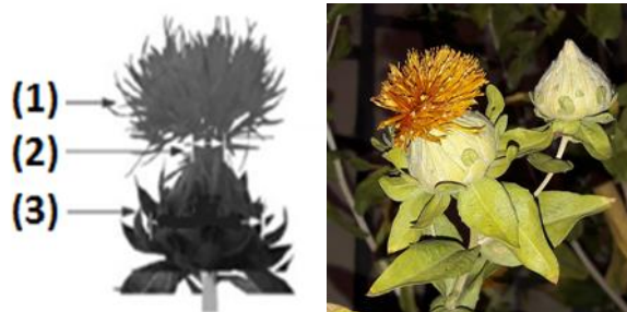
شکل ۱- قسمت‌های مختلف گل گلرنگ؛ گلبرگ (۱)، گردن (۲) و نهنج (۳)

اجزای تشکیل دهنده گل گلرنگ شامل گلبرگ، گردن و نهنج می‌باشد که از دانه‌های روغنی داخل نهنج به منظور تولید روغن