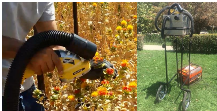
شکل ۴- ماشین فرغونی برداشت گلبرگ

در روش فرغونی از موتور برق با توان ۸kW به منظور راه‌اندازی واحد مکنده ۱۲۰۰W و ماشین برشی رفت و برگشتی استفاده شد.