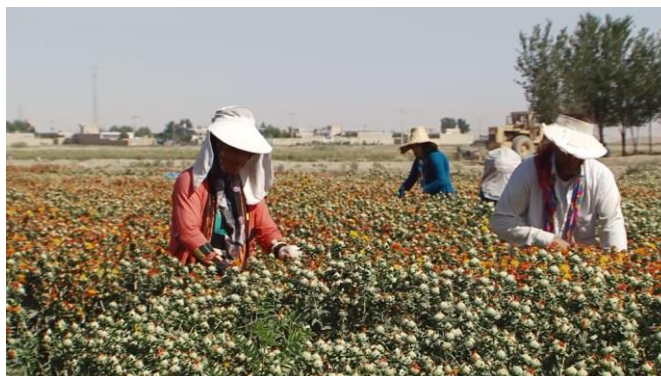
شکل ۲- برداشت به روش دستی Fig.2. Manual harvesting method

مکانیزم برشی مناسبی به منظور بهبود عملکرد دستگاه مزبور، طراحی و ساخته شود (شکل ۳-الف و ج).