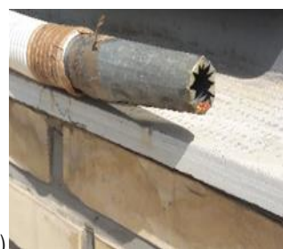
شکل ۳- ماشین پستی برقی اصلاح شده جهت برداشت گلبرگ (الف)، واحد برش اولیه (ب) و طرح‌واره‌ای از مکانیزم برش طراحی شده شامل آرمیچر (۱)، تیغه دوار (۲)، تیغه ثابت (۳) و لوله مکش (۴)