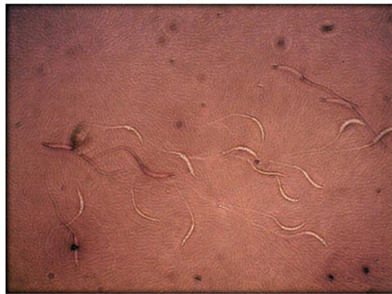
شکل ۱. رنگ‌آمیزی اسپرم توسط رنگ‌آمیزی ائوزین - نگروزین، رنگ ائوزین به داخل اسپرم‌های مرده نفوذ کرده، درحالی‌که اسپرم‌های زنده رنگ نگرفته‌اند.

برای ارزیابی میزان اسپرم‌های زنده و مرده پس از یخ-گشایی، از رنگ‌آمیزی ائوزین - نگروزین (رنگ ائوزین