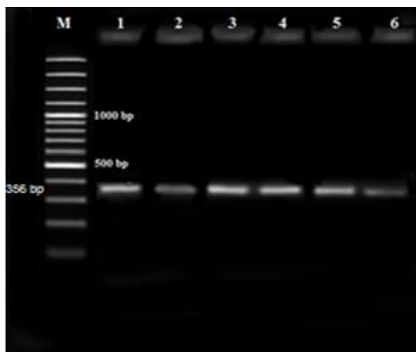
شکل ۲. الکتروفورز محصولات PCR ایترون ژن BMP15