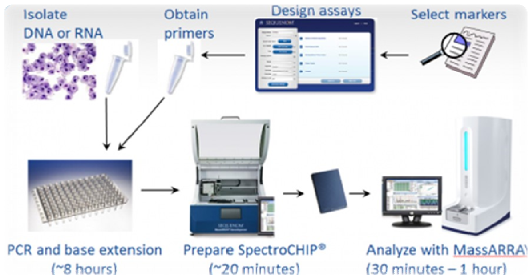
شکل ۱. مراحل تعیین ژنوتیپ با فناوری آپیکس

از دیگر مزایای این روش می‌توان به موارد زیر اشاره کرد: توان عملیاتی از متوسط به بالا، توزیع منظم و ساده در سطح پلکس، دامنه‌های وسیع عملیاتی از چند صد تا ۱۰۰ هزار ژنوتیپ در هر روز، مناسب برای نقشه‌برداری ژن‌ها در مطالعات GWAS و Microarray، کیفیت بالای داده‌ها، دقت