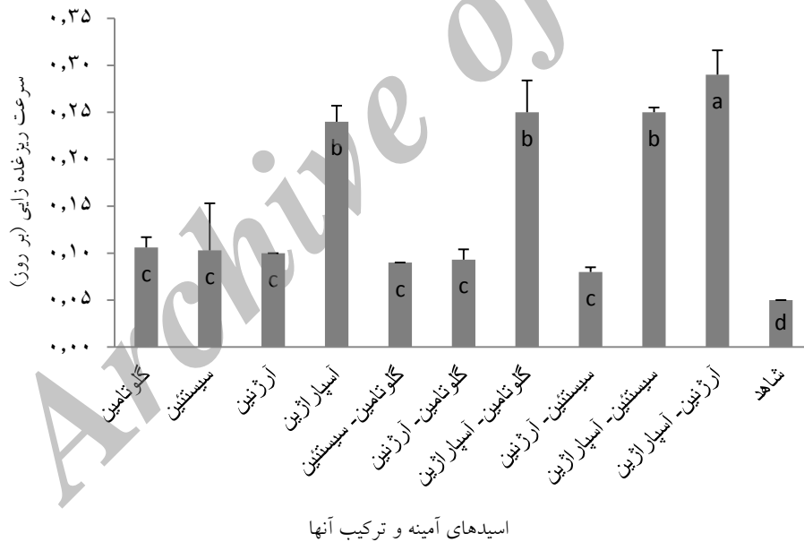
شکل ۲. سرعت ریزغده‌زایی در تیمارهای مختلف اسید آمینه (مقدار هر اسید آمینه ۱۰۰ میلی‌گرم در لیتر است)

متأثر شد ( P < 0.01 ). حداکثر سرعت ریزغده زایی مربوط به محیط کشت حاوی Arg-Asn بود، در حالی که حداقل سرعت ریزغده‌زایی در محیط کشت فاقد اسید آمینه مشاهده شد. تیمارهای آسپاراژین، گلو تامین-آسپاراژین و