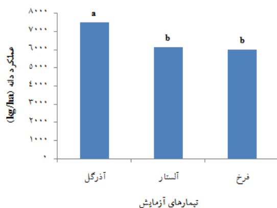
شکل ۲. عملکرد دانه در ارقام مختلف آفتابگردان

پوششی، عملکرد نیز تحت تأثیر قرار گرفت. عملکرد دانه آفتابگردان در حضور گیاهان پوششی گندم سیاه، یونجه یکساله و ماشک به ترتیب ۲۸/۶ و ۱۶/۳ و ۲۸، به شاهد وجین تمام فصل کاهش یافت (شکل ۳). تداخل علف‌های هرز نیز عملکرد دانه ارقام 'آذرگل'، 'آلستار' و 'فرخ' را به ترتیب ۱۸/۶، ۲۲/۱ و ۳۳/۴ درصد نسبت به شاهد وجین تمام فصل کاهش داد. کاهش شاخص سطح برگ و در نهایت کاهش عملکرد نیز در اثر تداخل علف‌های هرز گزارش شده است [۳۸، ۱۴]. استفاده از گیاهان پوششی گزینه مناسبی در سیستم‌های کشت پایدار است [۴۱].