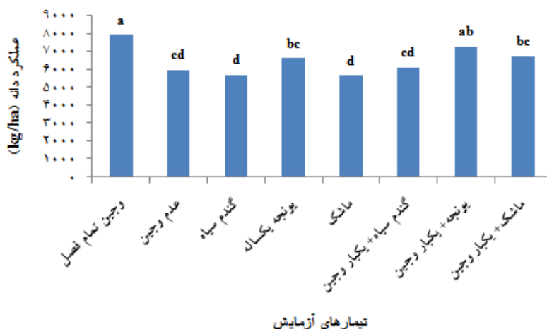
شکل ۳. اثر اعمال کنترل علف‌های هرز بر عملکرد دانه آفتابگردان