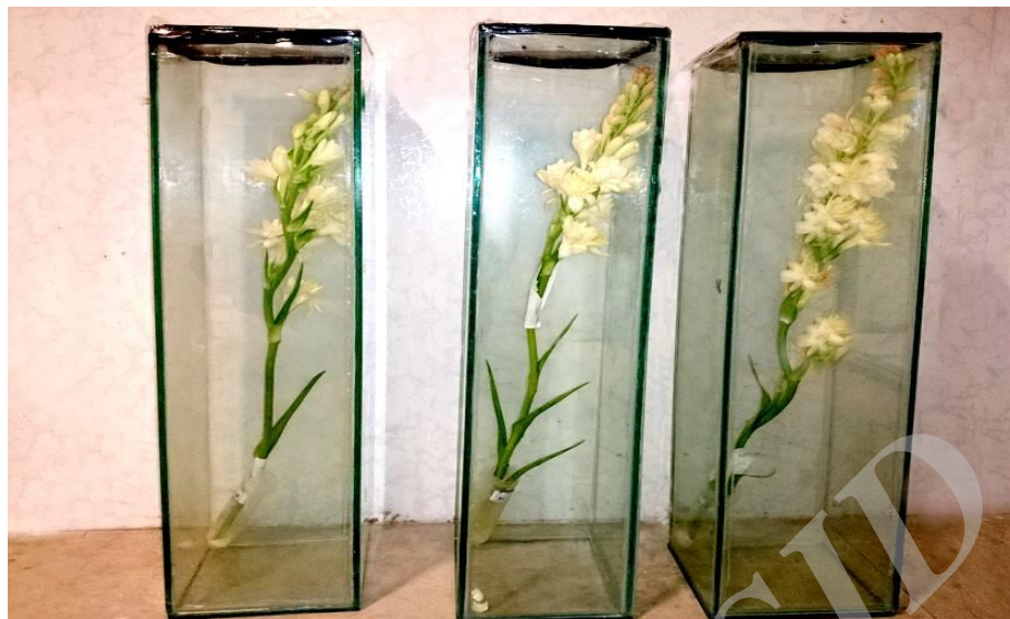
شکل ۱. ظروف شیشه‌ای طراحی شده جهت نمونه برداری و تعیین عطر گل مریم

در پی داشته است [۱۲ و ۲۷]. سالیسیلیک اسید نیز بسته به غلظت مورد استفاده سبب افزایش محتوای نسبی آب گل شاخه بریده مریم شد که می‌تواند به دلیل افزایش جذب آب از بستر بر اثر تبادلات گازی برگ با اتمسفر و همچنین نقش سالیسیلیک اسید در فرایند آنتی‌باکتریایی [۸] و در نتیجه جلوگیری از مسدودیت آوندی باشد که سبب افزایش محتوای نسبی آب گردیده است که با نتایج سایر تحقیقات بر روی گل‌های شاخه بریده میخک [۲۰] و گل رز [۳] مطابقت دارد.