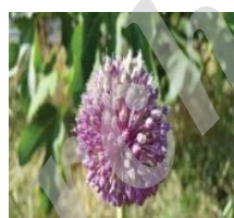
تهران A. iranica