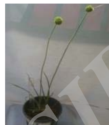
اردبیل A. atroviolaceum