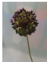
چهارمحال-دوراها A. atroviolaceum