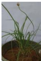
کرمان (u) A. umbilicatum