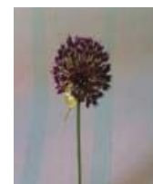
کرمان (a) A. atroviolaceum