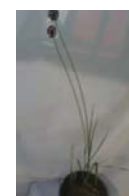
خرم‌آباد-زاغه A. atroviolaceum

شکل ۱. گونه‌های مختلف جنس Allium مورد مطالعه در این پژوهش تنوع زیادی از لحاظ شکل ظاهری گل و کیفیت زینتی گل مشهود است.