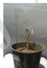
قزوین A. iranica