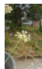
کرمان (i) A. lalesaricum