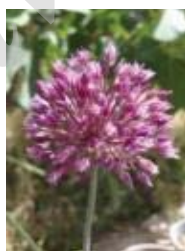
گیلان A. erubescens