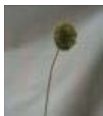
کهگیلویه A. atroviolaceum