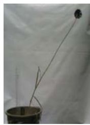
چهارمحال-کلواری A. atroviolaceum