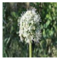
خراسان (i) A. oschanini