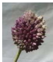
البرز (i) A. iranica