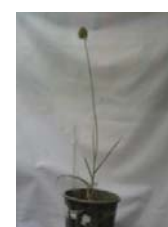
مرکزی A. atroviolaceum