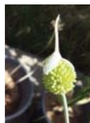
کردستان A. vineale