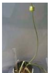
خرم‌آباد-یافته A. macrochaetum