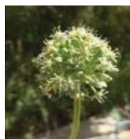
البرز (a) A. assarensis