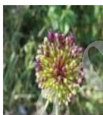
کرمانشاه A. atroviolaceum