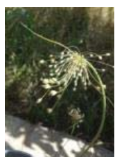
خرم‌آباد-تاف A. stamineum