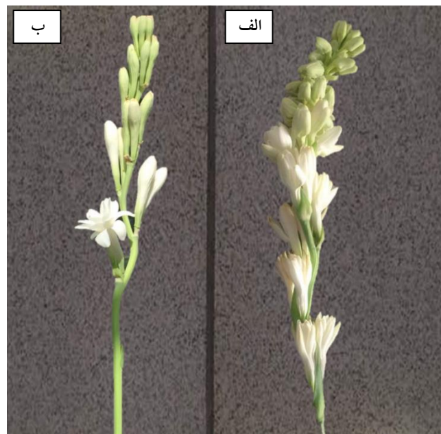
شکل ۳. گلچه‌های گل مریم تیمار نمونه ۲۰ درصد قارچ تریکودرما (الف) و نمونه شاهد (ب)

اثر ساده سطح تنش و سطح قارچ تریکودرما با سطح اطمینان ۹۹ درصد بر صفات تعداد گلچه باز شده و قطر گلچه معنی دار شد (جدول ۱). با افزایش سطح تنش تعداد