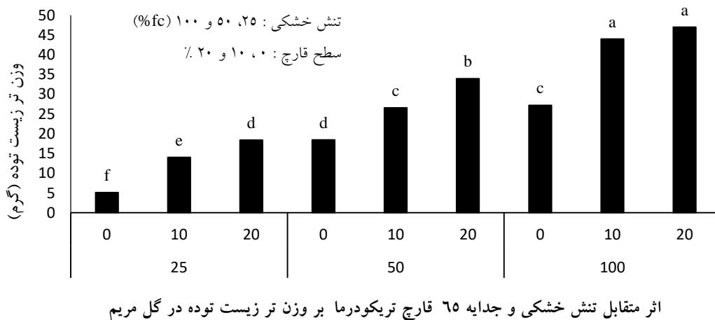
شکل ۲. اثر متقابل تنش خشکی و قارچ تریکودرما بر وزن تر زیست توده در گل مریم