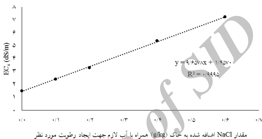
شکل ۱- رابطه بین مقدار NaCl اضافه شده (به صورت محلول) به خاک و EC e خاک.

که در آن‌ها، m_w : وزن خاک مرطوب (گرم)، Db_d و Db_w : به ترتیب جرم مخصوص ظاهری خشک و مرطوب (گرم بر سانتی متر مکعب)، V_t : حجم گلدان (سانتی متر مکعب)، \theta_m : رطوبت جرمی خاک (گرم بر گرم)، z : شعاع گلدان (سانتی متر) و h : ارتفاع گلدان می‌باشد.