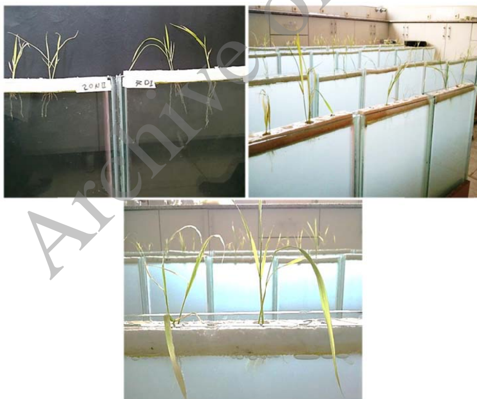
شکل ۱. ارزیابی صفات فنوتیپی در کشت هیدروپونیک