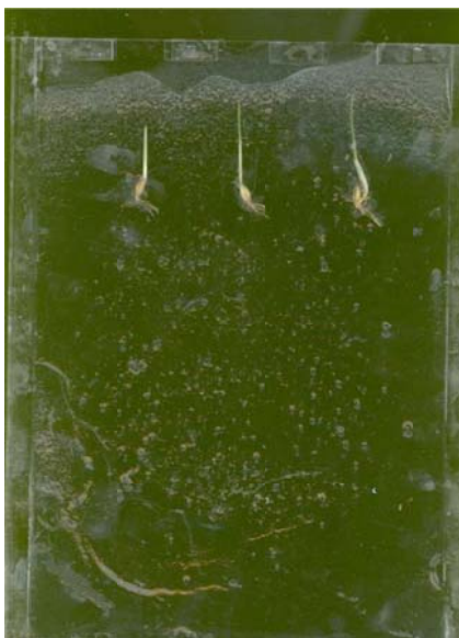
شکل ۱. نمایی از اتاقک ژل (نمونه حاضر تیمار شوری ۰/۲ مولار نمک است و از چپ به راست تیمارهای شاهد، هیدروپرایم و پرایمینگ با نیتروژن ۲ در هزار قرار دارند).

های هر رقم در یک آزمایش فاکتوریل دوعاملی مجزا و در قالب طرح پایه کاملاً تصادفی با سه تکرار بررسی شد. اتاقک‌ها ژل در دمای 12 \pm 1 درجه سانتی‌گراد به‌منظور حفظ ساختار فیزیکی فیتوژل و در تناوب ۱۲ ساعت روشنایی و ۱۲ ساعت تاریکی قرار گرفتند (Bengough et al., 2004). ۲۱ روز پس از شروع آزمایش، طول ریشه‌چه، وزن تر و خشک ریشه‌چه، حجم ریشه، وزن خشک، وزن تر و طول اندام هوایی و سطح سبز گیاهچه‌ها اندازه‌گیری شد.