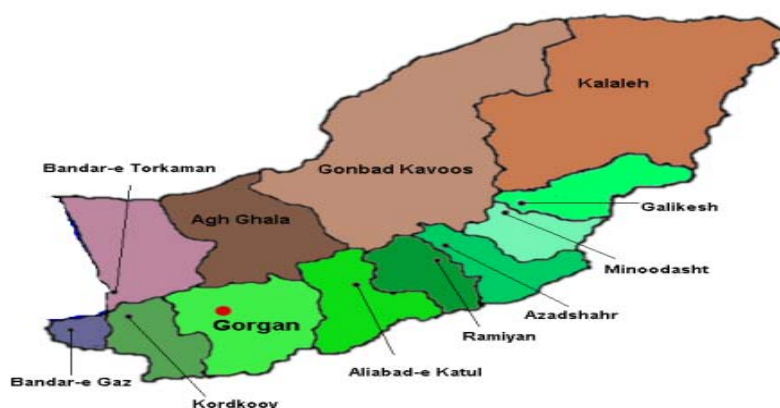
شکل ۱- نقشه استان گلستان