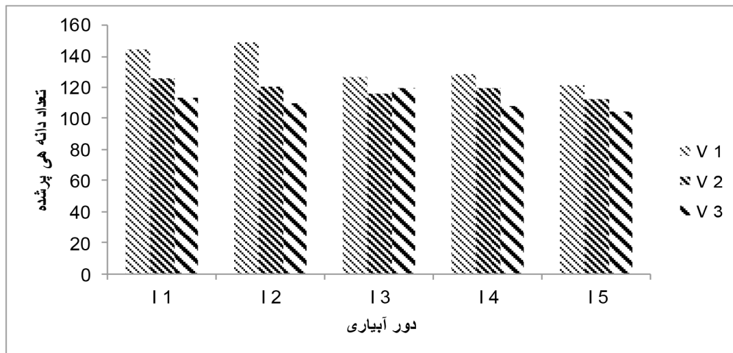
نمودار ۲- تأثیر فواصل مختلف آبیاری بر تعداد دانه های پر شده ارقام برنج

I1: آبیاری هر روزه، I2: آبیاری با فاصله ۴ روزه پس از پنجه زنی، I3: آبیاری با فاصله ۴ روزه پس از تشکیل جوانه اولیه خوشه در ساقه، I4: آبیاری با فاصله ۸ روزه پس از تشکیل جوانه اولیه خوشه در ساقه، I5: آبیاری با فاصله ۸ روزه پس از پنجه زنی