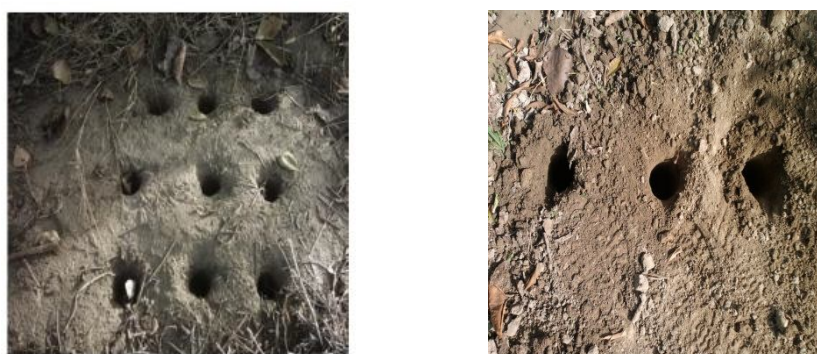
شکل 2- چگونگی برداشت رطوبت اطراف قطره چکان