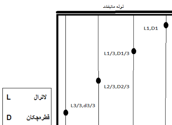
شکل 1- نمایی از نقاط نمونه گیری در باغات