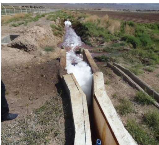
شکل ۳- نقطه خروجی تصفیه‌خانه

چرخه تغذیه انسان قرار دارد. همچنین پساب باید از کیفیت خوبی برای استفاده برخوردار باشد. وضعیت فعلی کارایی واحد تصفیه‌خانه شهری دشت بیرجند به گونه‌ای است که اولاً پساب خروجی کیفیت لازم را برای استفاده در زمین‌های زراعی کشاورزان ندارد و ثانیاً هیچ گونه نظارتی مبنی بر محدودیت کشت زراعی انجام نمی‌شود. تصاویر ۳ تا ۵ خود گویای این واقعیت تلخ است. آنچه از شکل ۳ بر می‌آید مؤید این مطلب است که متأسفانه پساب تصفیه‌خانه کیفیت لازم را برای تحویل به زارعین دارا نمی‌باشد. تولید کف سولفید کاملاً در شکل ۳ مشخص است.