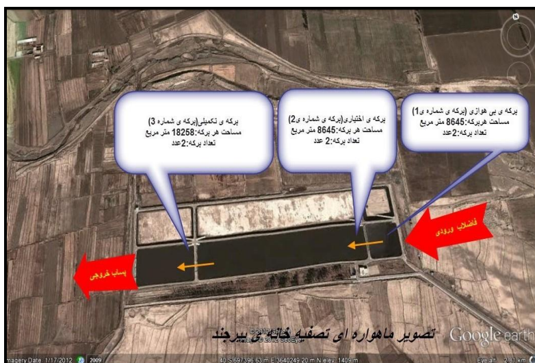
شکل ۲- تصاویر ماهواره‌ای تصفیه‌خانه فاضلاب شهری بیرجند