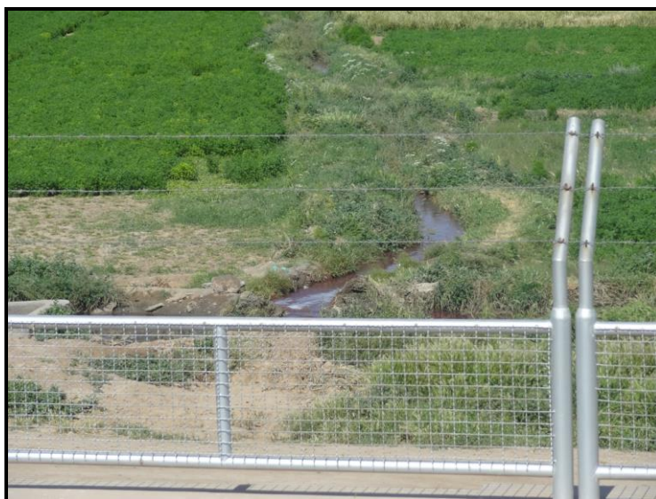
شکل ۴- تحویل پساب به کشاورزان بدون هیچ گونه نظارت

می باشد. مطمئناً افزایش غلظت این گاز (بدون هیچ گونه اعمال محدودیت در زمینه انتشار و جمع آوری آن) جدا از بوی بد، باعث تشدید اثر سوء اثرات تغییر اقلیم در دید منطقه ای خواهد شد. متأسفانه عدم انتخاب روش صحیح تصفیه فاضلاب در شهر بیرجند باعث تولید حجم انبوهی از گاز متان و پخش آن در منطقه شده است. موارد فوق نشان از این دارد که واحد تصفیه خانه فاضلاب شهری بیرجند نتوانسته است معیارهای فنی لازمه را داشته باشد.