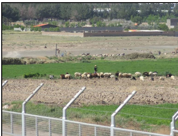
شکل ۵- چرای دام در مزارع آبیاری شده با پساب فاضلاب