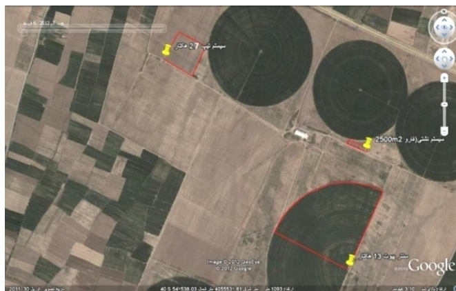
شکل 2- سامانه های آبیاری اجرایی در مزرعه

سیستم سنتریوت انتخابی در این تحقیق مربوط به چاه شماره 4 مزرعه قادری، 10 دهانه با طول بازوی 410 متر می باشد که مساحت یک ربع از دایره تحت پوشش سنتر شامل 2، 13 هکتار به این طرح اختصاص داده شد. هر دهانه 9 عدد لوله 6 متری متصل به هم دارد که بر روی هر لوله 2 عدد آبپاش نصب گردیده است که در مجموع هر دهانه 18 عدد آبپاش دارد. دهانه ابتدایی سنتر 3 آبپاش ابتدایی مسدود می باشد، لذا برای 10 دهانه سنتر، از 177 عدد آبپاش به شماره نازل های 9 تا 46 استفاده گردید. به دلیل نبود سه آبپاش ابتدایی سنتر، به فاصله 8 متری از مرکز سنتر آبیاری صورت نگرفت که این مساحت از کل مساحت آبیاری 13/2 هکتار، کسر و در نهایت 13/18 هکتار تحت آبیاری سنتر قرار گرفت. فشار اندازه گیری شده توسط فشارسنج نصب شده روی هیدرانت به میزان 1/25 بار اندازه گیری شد. روی لوله هیدرانت متصل به سنتر پس از برش لوله کنتور حجمی 6 اینچی هم قطر با لوله هیدرانت نصب گردید. آبیاری (آبیاری توسط مدیریت آبیاری و با نظارت کامل محقق انجام گرفته است) سه روز پس از کاشت ذرت بذری در تاریخ 7/2/1391 شروع و در 16/6/1391 پایان یافت. در هنگام آبیاری این قطعه، اپراتور سنتر، شماره کنتور در ابتدا و انتهای آبیاری و سرعت دستگاه را ثبت نمود. دور آبیاری بر اساس تجربیات مزرعه و نمایه های گیاهی به طور