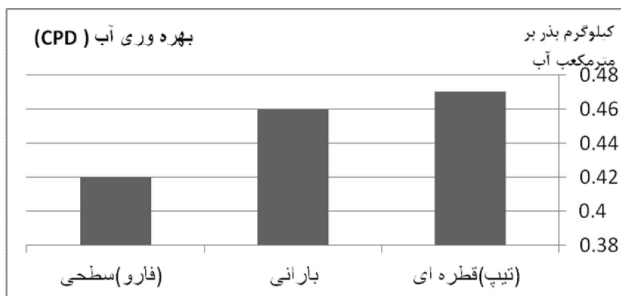
شکل 3- نمودار مقایسه‌ای از بهره‌وری سه سیستم آبیاری در ذرت بذری

از طرفی جهت محاسبه بهره‌وری آب مصرفی می‌بایست عملکرد واحد سطح مزرعه هر سیستم را محاسبه نمود. که پس از برداشت،