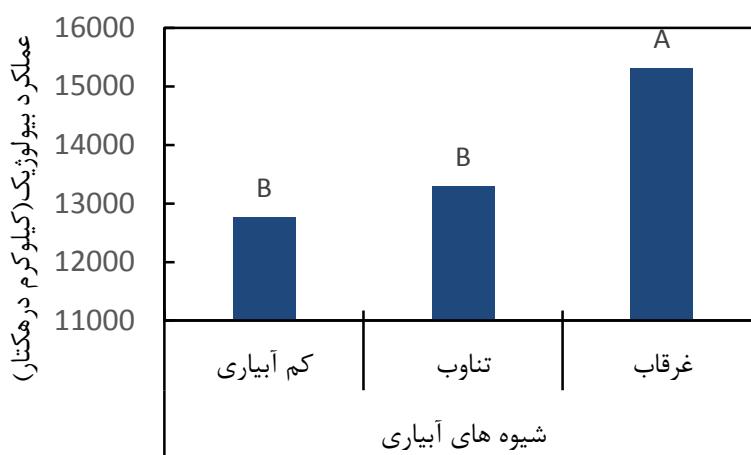
شکل ۳- مقایسه میانگین عملکرد بیولوژیک در شیوه‌های مختلف آبیاری