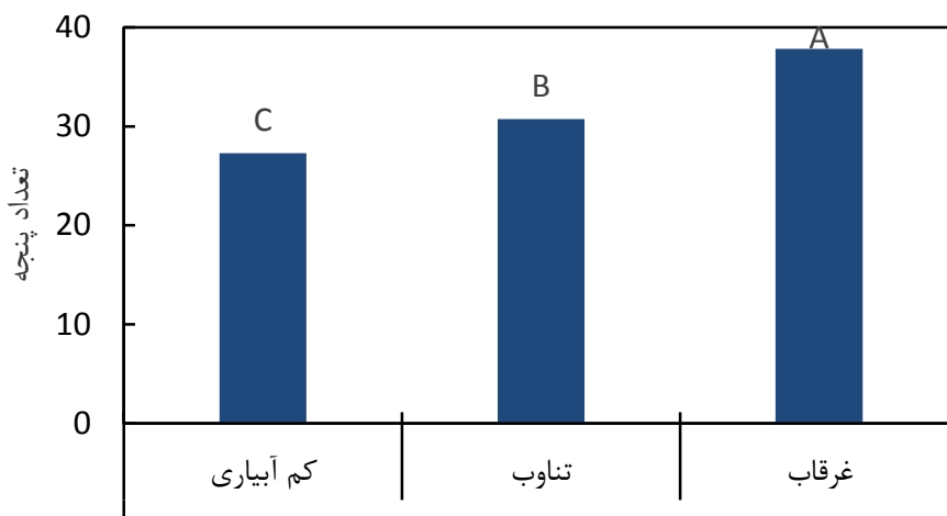
شکل ۲- مقایسه میانگین تعداد پنجه در شیوه‌های مختلف آبیاری

(شکل ۳). کم‌ترین مقدار عملکرد بیولوژیک در تیمار کم آبیاری (۱۲۷۶۴/۶ کیلوگرم در هکتار) و بیشترین مقدار آن مربوط به نظام غرقاب (۱۵۳۱۳ کیلوگرم در هکتار) بود. با توجه به برتری صفت تعداد پنجه در تیمار غرقاب و اثر آن بر عملکرد بیولوژیک به‌عنوان یک جز مهم عملکرد، افزایش عملکرد بیولوژیک بدیهی است. حسنی و همکاران (۱۳۹۰) به این نتیجه رسیدند که بیشترین میزان عملکرد بیولوژیک و تعداد پنجه بارور به روش غرقابی و کمترین میزان عملکرد دانه مربوط به روش دیمی بود. نتایج یک مطالعه در فیلیپین نشان داد که با حفظ رطوبت خاک در حد اشباع، به‌طور متوسط عملکرد بیولوژیک تا ۵ درصد کاهش یافت (Tabbal et al., 2010). عرب زاده (۱۳۹۲) طی پژوهشی به این نتیجه رسید که بیشترین عملکرد بیولوژیک مربوط به غرقاب بود. نتایج برخی از تحقیقات گذشته حاکی از آن است که استفاده از آبیاری تناوبی باعث کاهش عملکرد بیولوژیک شد (Dahal et al., 2012). علی‌رغم تفاوت معنی‌دار عملکرد بیولوژیک، اختلاف بین عملکرد دانه در تیمارهای مختلف (غرقاب: ۵۰۳۰؛ اشباع: ۵۱۰۵/۷ و کم آبیاری: ۴۹۰۳/۴ کیلوگرم در هکتار) معنی‌دار نبود. یکی از علت‌های احتمالی بیشتر بودن عملکرد بیولوژیک در تیمار غرقاب و در عین حال فقدان اختلاف معنی‌دار عملکرد دانه در مقایسه با کم آبیاری را می‌توان به به این مورد مرتبط دانست که بخش عمده ماده خشک به قسمت کاه انتقال یافته است (داده‌های منتشر نشده).