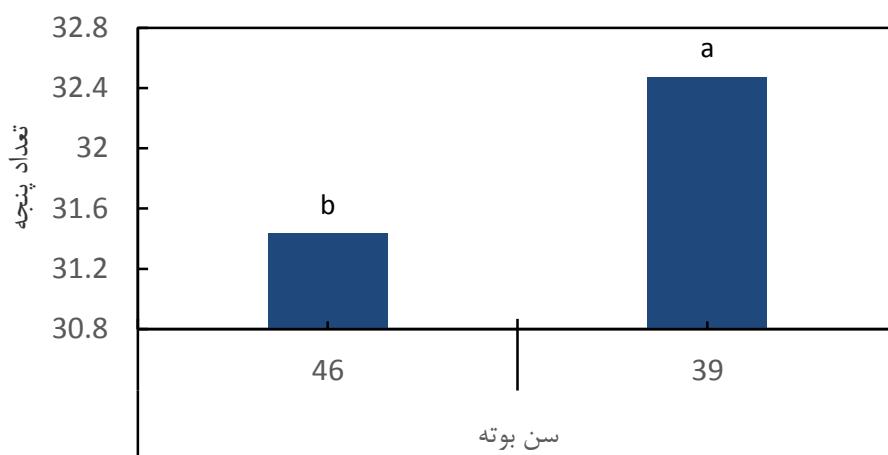
شکل ۴- مقایسه میانگین تعداد پنجه در تیمارهای سن بوته

تیمار کم آبیاری از نظر تعداد پنجه اختلاف معنی‌دار داشتند. مقایسه میانگین سطوح زمان انتقال بوته در سطح تیمار کم آبیاری نشان از برتری شیوه رایج از نظر تعداد پنجه داشت (جدول ۵). یافته‌های تحقیقی نشان‌دهنده بیشتر بودن تعداد پنجه در تیمار ترکیبی کم-آبیاری و سن ۱۵ روز بود اما اختلاف تعداد پنجه در دو تیمار ترکیبی معنی‌دار نبود (Ali et al., 2013).