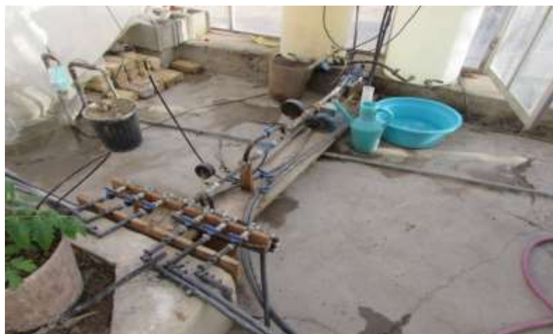
شکل ۶- سامانه اکسیژن - آبیاری در حال کار در گلخانه

برداشت میوه از دهه سوم آذرماه یعنی حدود ۲ ماه پس از انتقال نشاءها آغاز و تا زمان بوته‌کشی و جمع‌آوری بوته‌ها ادامه داشت. از آغاز باردهی بوته گوجه‌فرنگی، به صورت هفتگی عملکرد محصول، آب مصرفی در تیمارهای مختلف، تعداد میوه در بوته، ارتفاع بوته و خصوصیات ظاهری گوجه‌فرنگی نظیر اندازه و وزن غده و نیز در پایان آزمایش، وزن ریشه خشک اندازه‌گیری شد. برای تأمین سطوح موردنظر تهویه آب آبیاری، روی لوله آبیاری هر یک از تیمارهای ۱۲ درصد و ۲۴ درصد یک ونتوری Mazzei™ مدل ۲۸۷ نصب شد. در