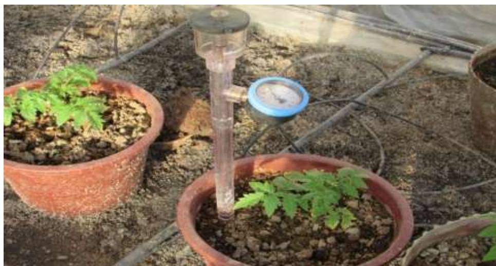
شکل ۵- قرانت مقادیر رطوبت در گلدان‌ها به وسیله تانسیمتر

ابتدای هر ونتوری، یک لوله برگشت (به مخزن آب) همراه با یک شیر برای تنظیم فشار در قسمت ورودی ونتوری تعبیه شده بود. انتهای لوله آبیاری باز نگه داشته شده بود تا آب مازاد بر مصرف آبیاری، به مخزن آب برگردد. تنظیم فشار در قسمت خروجی ونتوری توسط شیریه که در انتهای لوله آبیاری نصب شده بود، انجام می‌گرفت. فشار آب در ورودی ونتوری برای تیمارهای ۱۲ و ۲۴ درصد، به ترتیب ۲۰۶/۸ و ۲۶۲ کیلو پاسکال، و در قسمت خروجی ونتوری برای هر دو تیمار ۶۲ کیلو پاسکال بود (شکل ۶).