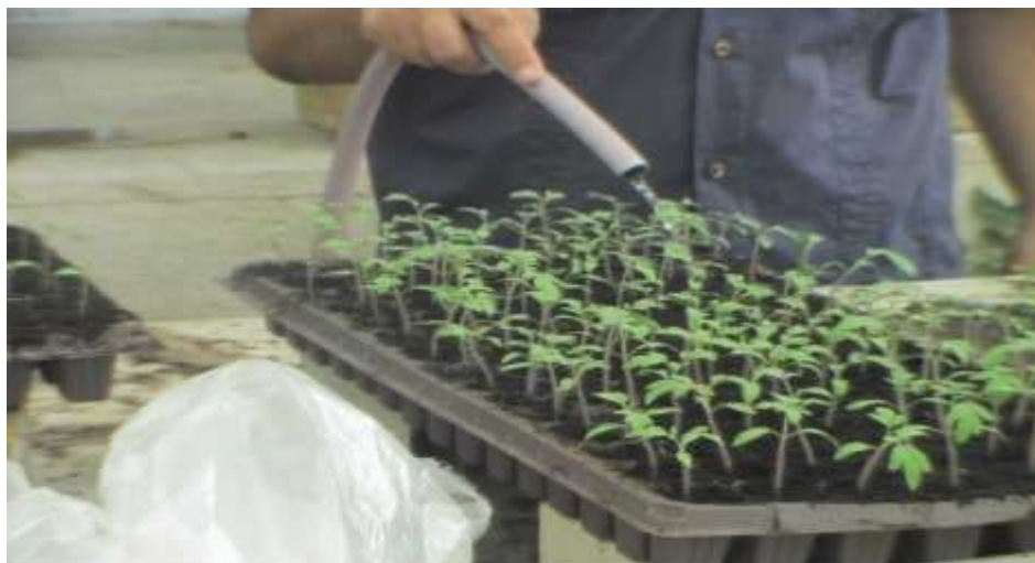
شکل ۲- نگهداری نشاءها در سالن نشاء

متر بود. کاشت در گلدان‌های به قطر ۳۰ و ارتفاع ۳۰ سانتیمتر انجام شد. فاصله ردیف‌های گلدان از یکدیگر ۱۲۰ سانتی‌متر بود (شکل ۳). با توجه به اینکه در اکثر گلخانه‌های استان اصفهان کشت به صورت خاکی صورت می‌گیرد، بستر کاشت مورد استفاده در این طرح نیز خاک بود که از مزارع منتخب با بافت رس تهیه شد. آرایش طرح به صورت زیر در شکل ۴ اجرا شد.