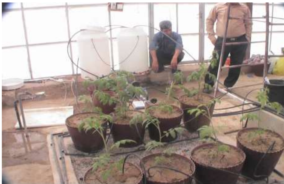
شکل ۳- آرایش تیمارها شامل ۴ ردیف گیاه

هدایت الکتریکی (EC) آب آبیاری در محل آزمایش ۳-۴ دسی زیمنس بر متر اندازه‌گیری شد. طرح آزمایش به صورت طرح بلوک‌های کاملاً تصادفی شامل ۳ سطح تهویه آب آبیاری شامل صفر٪ (تیمار شاهد)، ۱۲٪ و ۲۴٪ (نسبت حجم هوا به حجم آب)، در ۴ تکرار اجرا شد. نخست، بذر گوجه‌فرنگی را در خزانه کاشته و پس از جوانه‌زدن هنگامی که چهار برگه شدند، به محل اصلی منتقل و تیمارها اجرا شدند. هر تیمار شامل ۴ ردیف گیاه هر یک به طول ۱۰