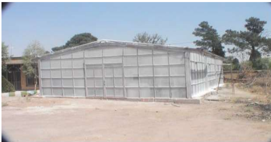
شکل ۱- گلخانه شیشه‌ای مرکز تحقیقات و آموزش کشاورزی و منابع طبیعی اصفهان (محل اجرای طرح)

در اکثر شهرک‌های گلخانه‌ای کشور عامل اصلی محدودکننده کشت‌های درون گلخانه، شوری آب آبیاری می‌باشد (نه کمبود آب)،