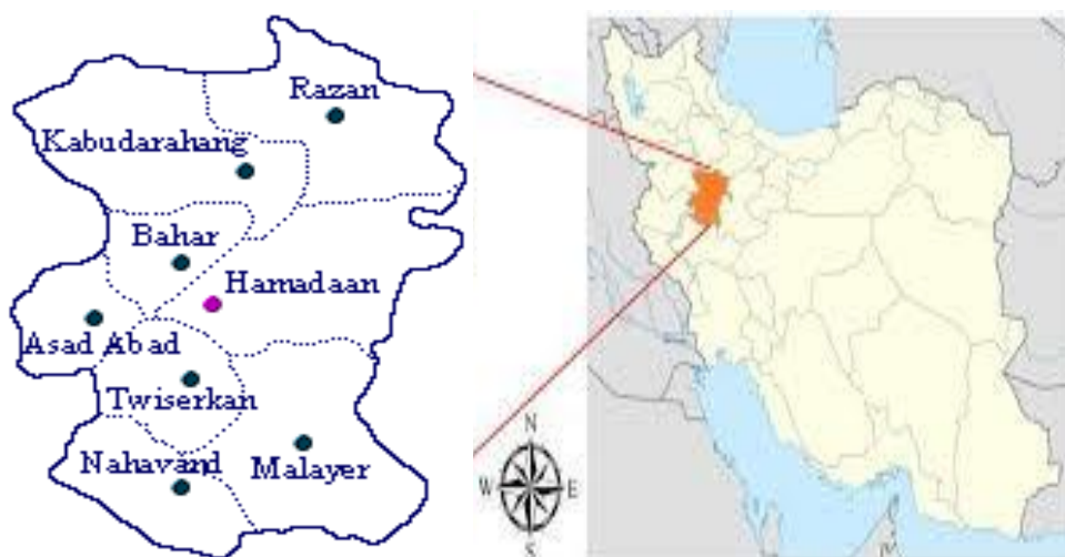
Fig. 1-The Geographic location of the study area

شهرستان همدان با وسعتی حدود ۴۱۱۸ کیلومتر مربع، از خط‌الرأس رشته‌کوه الوند تا مرزهای شرقی این استان کشیده شده است (شکل ۱). شرقی‌ترین نقطه این شهرستان ۴۹ درجه و ۲۷ دقیقه و غربی‌ترین آن ۴۸ درجه و ۲۰ دقیقه از نصف‌النهار گروینچ فاصله دارد و از شمال به شهرستان کبودرآهنگ، از جنوب به