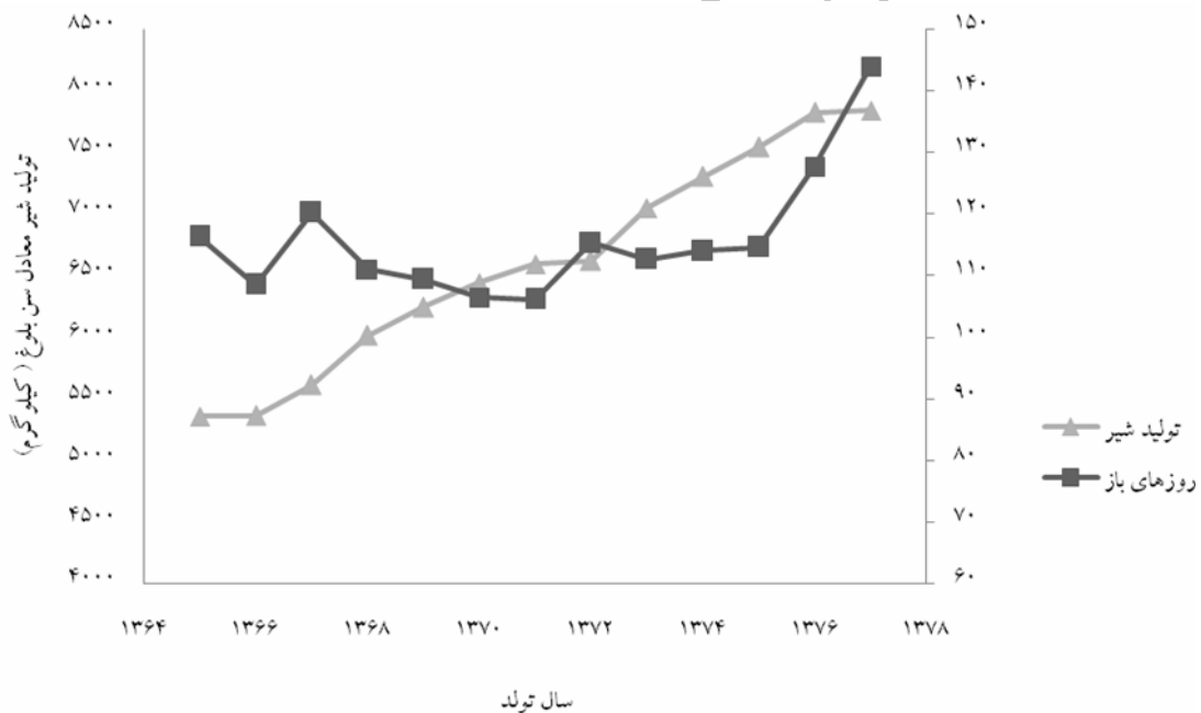
نمودار ۳- روند فنوتیپی تولید شیر و روزهای باز گاوهای شیری هلشتاین در دوره اول شیر دهی

پز و همکاران (۱۷)، همبستگی ژنتیکی و فنوتیپی بین تولید شیر و روزهای باز را به ترتیب +0.66 و +0.10 گزارش کردند. نتایج این پژوهش با گزارش سایر محققین مطابقت دارد (۱، ۴، ۱۸). همبستگی ژنتیکی مثبت تولید شیر و فاصله دو زایش، موجب می‌گردد تا انتخاب برای افزایش تولید شیر سبب افزایش فاصله دو زایش و روزهای باز شود (۱۱). مطالعه همبستگی ژنتیکی تولید شیر و روزهای باز در شکم‌های زایش اول، دوم و سوم به ترتیب +0.27 ، +0.31 و +0.3 گزارش کردند (۱۶). اسکات و همکاران (۲۶)، رابطه منفی تولید شیر و باروری را گزارش کردند.