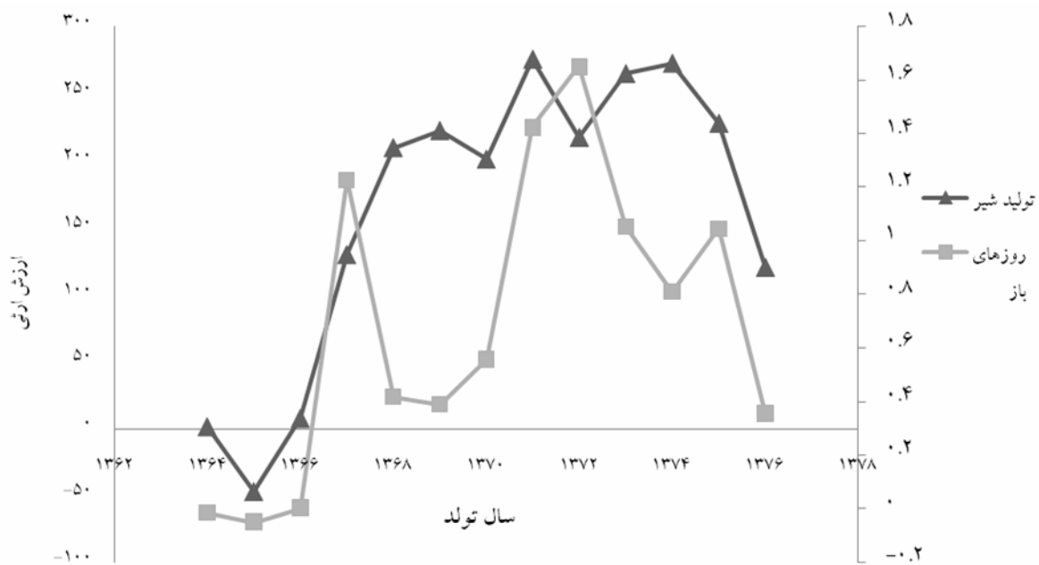
نمودار ۴- روند ژنتیکی تولید شیر و روزهای باز گاوهای شیری هلشتاین در شکم اول زایش