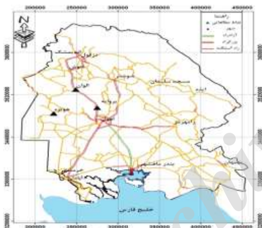
شکل ۱. نقشه موقعیت مکانهای نمونه‌برداری

و اقتصادی وارد می‌کند، بدین منظور از سه محدوده از کانون‌های بحران‌زای فرسایش بادی در استان خوزستان شامل منطقه روبروی بروایه (که خاک آن محدوده ماسه‌بادی بوده و شدت فرسایش بادی در آن به حدی است که ریشه برخی درختان در سطح خاک نمایان گردیده است) با مختصات 31^{\circ}57' عرض شمالی، 48^{\circ} طول شرقی و 31^{\circ}91' عرض شمالی و منطقه هویزه با مختصات 31^{\circ}63' عرض شمالی، 48^{\circ}9' طول شرقی (تا عمق ۵ سانتیمتری) از نقاط بدون پوشش گیاهی و از محل‌هایی صورت پذیرفت که هیچ‌گونه عارضه‌ای در مسیر جریان باد قرار نداشت. تصویر موقعیت نمونه‌برداری‌ها در شکل شماره یک نشان داده شده است. سپس نمونه‌ها به آزمایشگاه منتقل گردید.