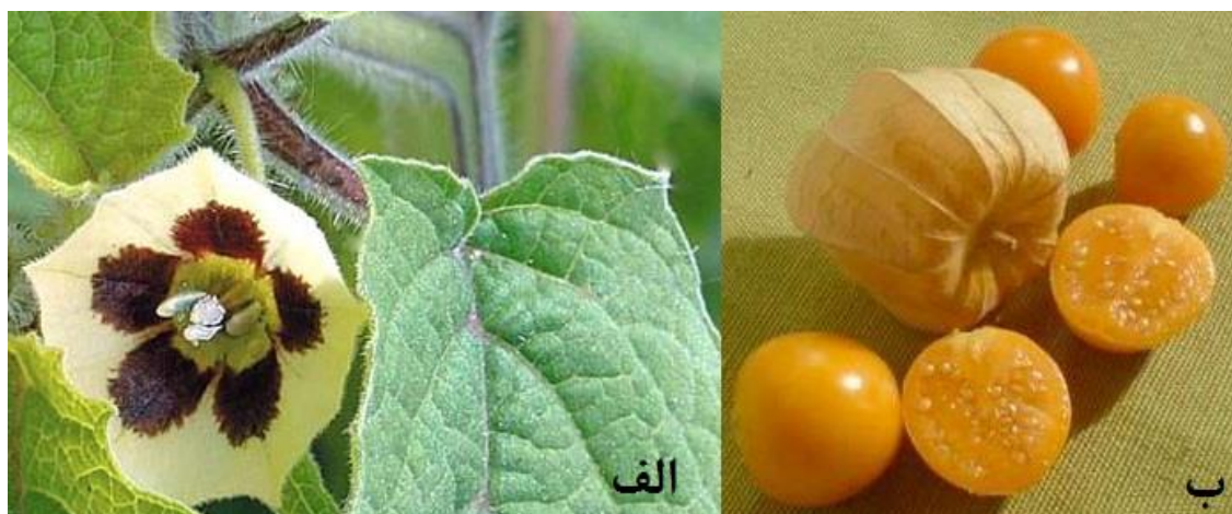
شکل ۱. الف) مرحله گلدهی (ب) مرحله میوه‌دهی