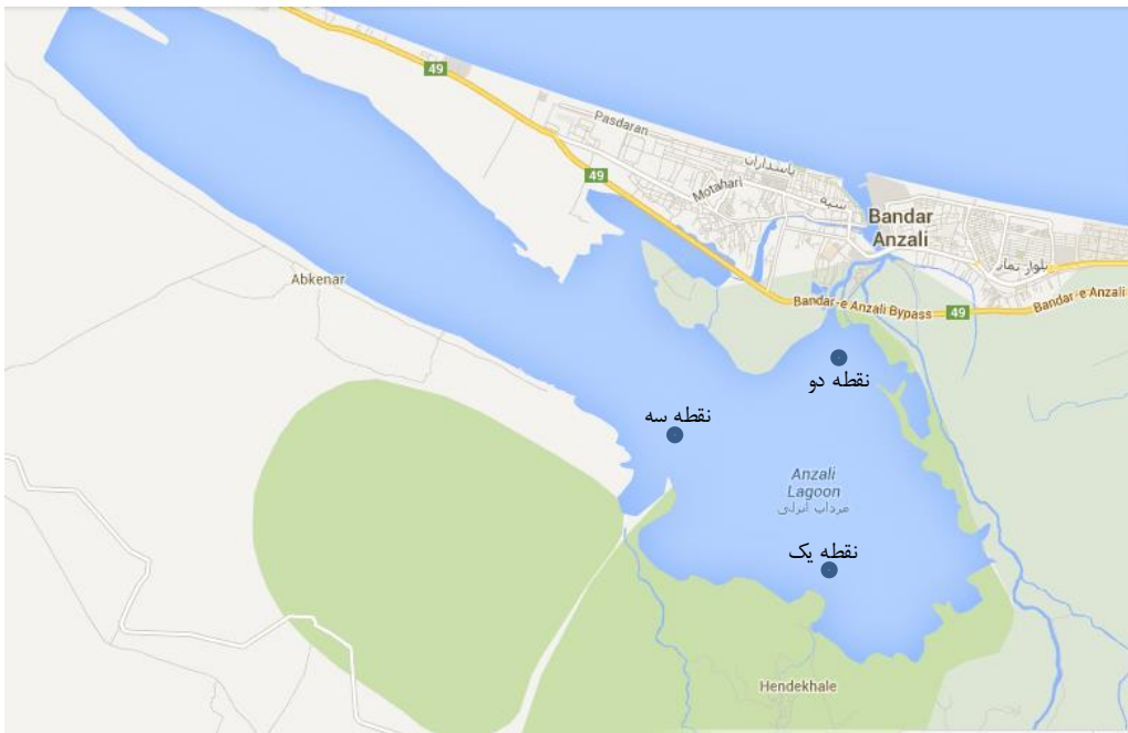
شکل ۱- نقشه تالاب انزلی و رودخانه های منتهی به تالاب (Google Map)

که در رابطه فوق، ESUN_\lambda میانگین تابش فرودی خورشید