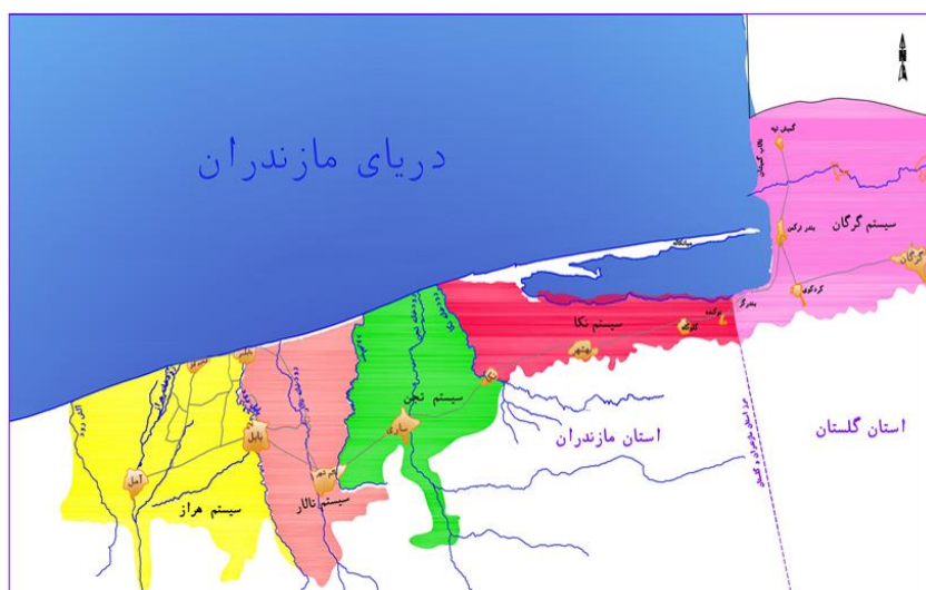
شکل ۱. محدوده عمومی سیستم‌های مطالعاتی

محدوده مورد مطالعه در ساحل جنوبی دریای خزر و خلیج گرگان و در ناحیه‌ای بین عرض جغرافیایی 35^{\circ}-45' تا 36^{\circ}-10' شمالی و طول جغرافیایی 50^{\circ}-55' تا 44^{\circ}-45' شرقی واقع شده و از نظر تقسیمات کشوری عمدتاً به استان‌های مازندران و گلستان تعلق دارد. گستره انجام کار شامل بخشی از استان مازندران به عنوان حوضه مبدا و استان گلستان بعنوان حوضه مقصد می‌باشد. جهت انتقال آب مازاد، سامانه انتقال از رودخانه هراز در رقوم ۱۶۴ متر از سطح دریا شروع و بصورت ثقلی در رقوم ۶۸ متر از سطح دریا آب را به محل رودخانه تجن انتقال می‌دهد. نیاز آبی شبکه نکا که تحت پوشش سد مخزنی گله‌ورد می‌باشد توسط کانال و تونل از محل رودخانه تجن در رقوم ۱۳۵ متر به شبکه نکا تحویل می‌گردد. آب شرب گلستان از سد مخزنی گله‌ورد که تراز نرمال آن ۷۳۰ متر بوده در رقوم ۶۷۰ متر آبیگیری می‌شود و با احداث مخازن تقلیل فشار و خطوط لوله فولادی پس از طی ۸۳ کیلومتر شامل ۷/۶۵ کیلومتر تونل و ۷۵/۳۵ کیلومتر خط لوله در رقوم ۱۵۰ متر از سطح دریا به شهرستان گرگان تحویل می‌گردد. براساس منابع، تامین آب اراضی به بخش‌های مجزا تقسیم شده که به هر قسمت آن سیستم مطالعاتی گفته می‌شود. سیستم‌های مطالعاتی به ترتیب از غرب به شرق شامل سیستم‌های هراز، تالار،