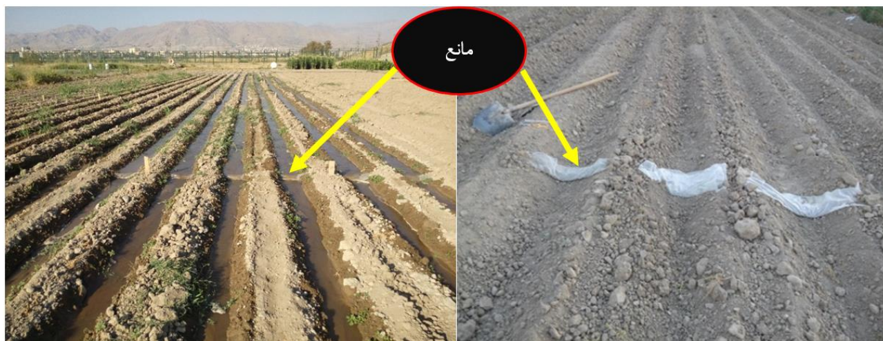
شکل ۱- نمایی از چویچه‌های آزمایشی و موانع ایجاد شده در آن

شیب چویچه‌ها برابر ۰/۹۶ درصد به دست آمد. در تمام آزمایش‌ها، هر سه چویچه آبیاری شدند و اندازه‌گیری‌ها در چویچه وسط انجام شد. چویچه‌های کناری به عنوان چویچه‌های محافظ و برای در نظر گرفتن اثر حاشیه‌ای و ایجاد شرایط واقعی، لحاظ شدند. چویچه‌ها انتها باز در نظر گرفته شدند. در این تحقیق، برای اندازه‌گیری دبی جریان ورودی و رواناب خروجی از چویچه‌ها، از فلوم