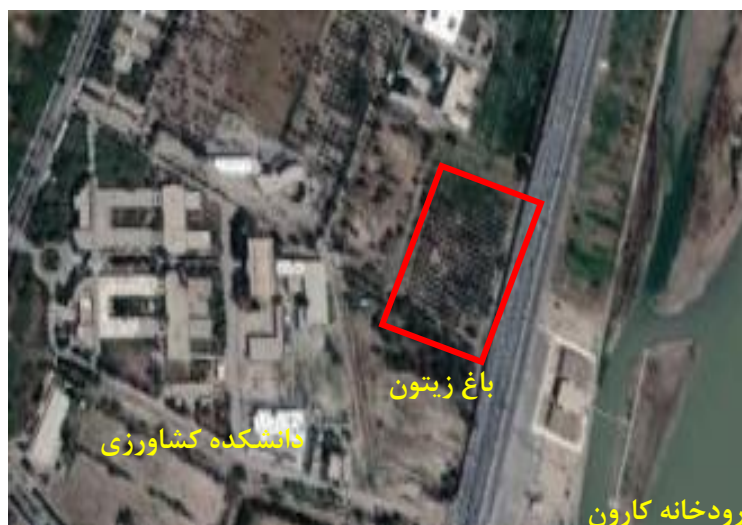
شکل ۱. موقعیت جغرافیایی باغ زیتون