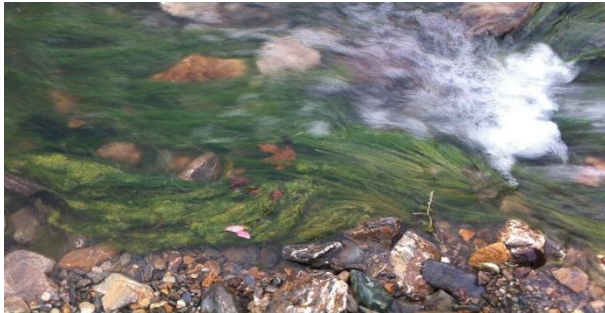
شکل ۲- شدت حضور جوامع جلبکی در نواحی آلوده رودخانه بوژان شهرستان نیشابور (چپ) در مقایسه با نواحی بالادست و سالم رودخانه خرو (راست)

بررسی از جوامع جلبک‌های سنگ‌زی بعنوان نشانگر زیستی استفاده کردند و ارتباط این جوامع با ترکیب شیمیایی آب را نشان دادند.