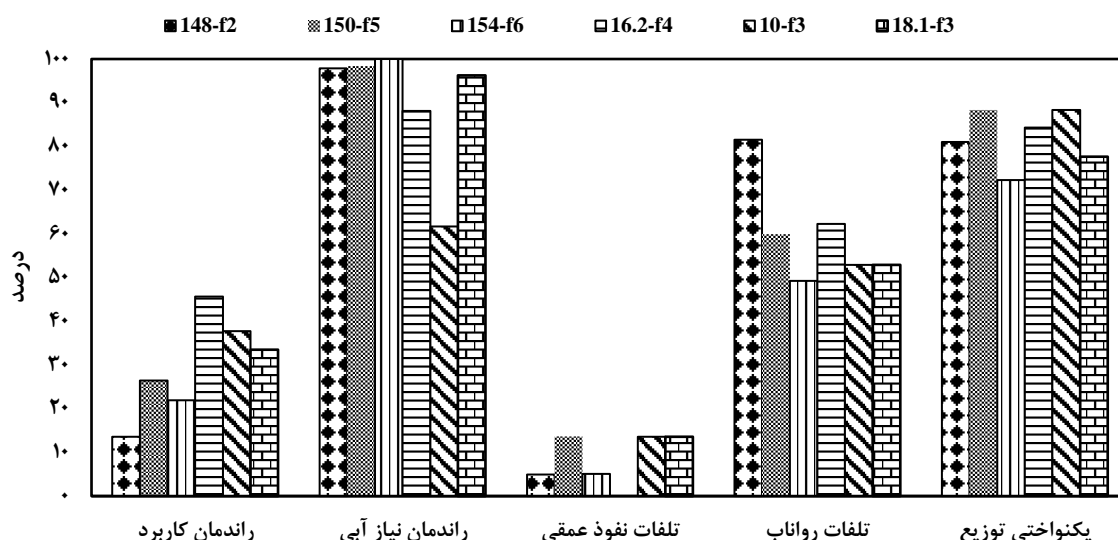
شکل ۱- میانگین راندمان کاربرد (Ea)، راندمان نیاز آبی (Er)، یکنواختی توزیع (DU)، تلفات نفوذ عمقی (DPR) و رواناب (TWR) در مزارع مورد بررسی در مناطق دیلم و BC در کشت و صنعت شهید بهشتی

ریشه گیاه نسبت به مزارع منطقه BC کمتر بوده است، عمق آب نفوذ یافته در خاک توانسته است نیاز آبی گیاه را تأمین نماید. عدم رعایت اصول مهندسی در آبیاری این مزرعه سبب شده تا علاوه بر کاهش راندمان آبیاری، نیاز آبی گیاهان هم تأمین نگردد. راندمان نیاز آبی تنها در مزرعه f6-154 در منطقه دیلم برابر ۱۰۰ درصد به دست آمد این در حالی است که مقدار راندمان کاربرد در این مزرعه بسیار پایین بود.