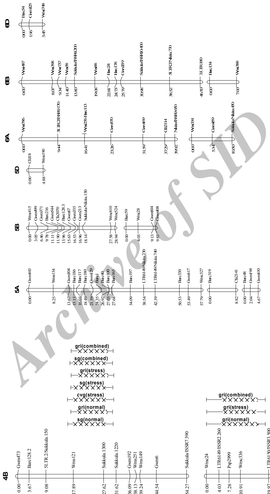
ادامه شکل ۱- نقشه پیوستگی صفات مختلف و QTL های شناسایی شده در ۱۴۹ لاین RIL و والدین آنها (No.49 × Yecora) در دو شرایط نرمال و تنش رطوبتی