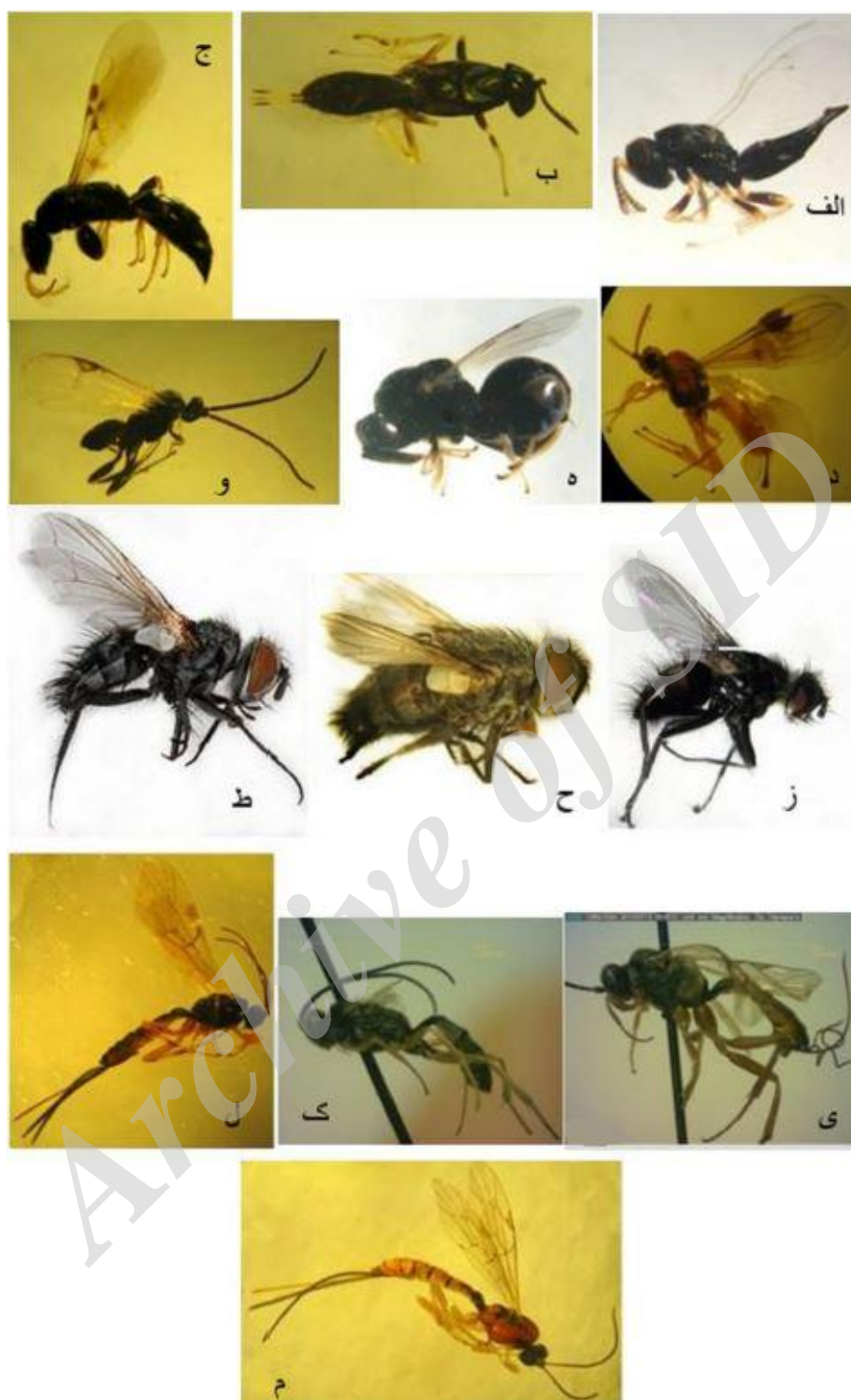
عکس ۳: پارازیتوییدهای جوانه خوار بلوط، الف- Mesopolobus sp. - ب- Eupelmus sp. - ج- Goniozus yezo Terayama, 2006 - د- Bracon sp. - ه- Brachymeria minuta (Linnaeus, 1767) و Apanteles sp. - ز- Nemorilla maculosa (Meigen, 1824) - ح- Pales pavidus (Meigen, 1824) - ط- Eumea mitis (Meigen, 1824) - ی- Lissonota palpalis Thomson, 1889 ، ک- Diadegma longicaudatum Horstmann, 1969. ل- Temelucha lucida (Szépligeti, 1899) - م- Scambus elegans (Woldstedt, 1877) (اصلی).